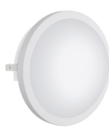
Far Round Led